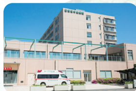
国立病院機構西埼玉中央病院