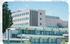
国立病院機構東埼玉病院