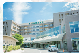
国立病院機構埼玉病院